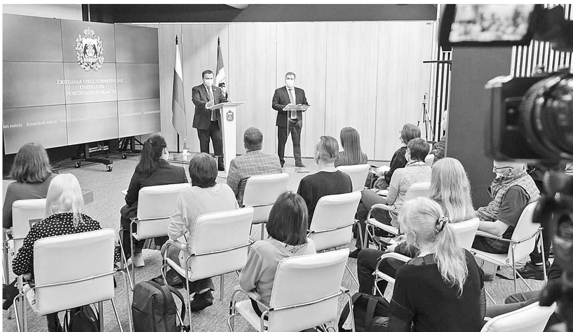
На пресс-конференцию Андрея Никитина приехали журналисты большинства СМИ области

Пандемия в меньшей степени влияет на отрасль АПК, и аграрии области показывают неплохие результаты. В этом году хороший урожай овощей, картофеля. Есть прирост по поголовью КРС. И по молочному производству — впервые за много лет по этому