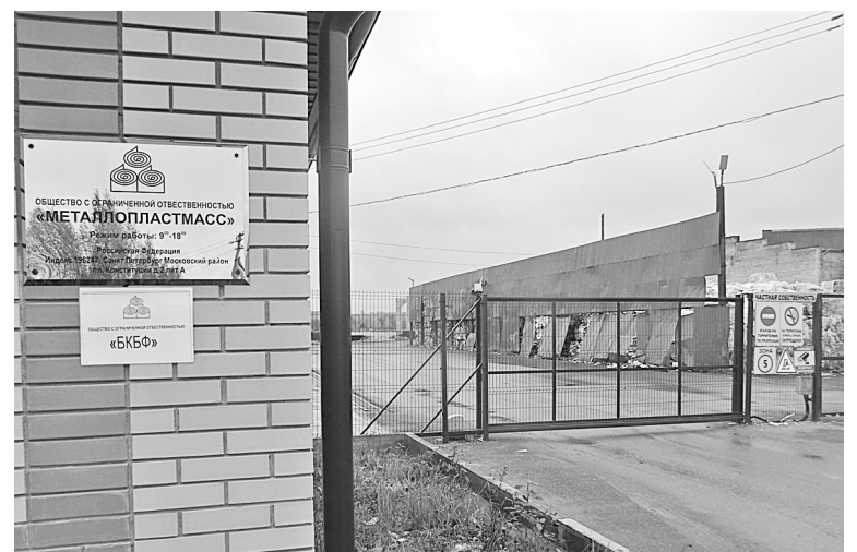
На Боровичской картонно-бумажной фабрике планируется строительство производственно-складского комплекса. Общий объем инвестиций составит более 800 млн. руб.

Напомним, совет при губернаторе Новгородской области по улучшению инвестиционного климата создан для развития инвестиционной привлекательности, экспорта, конкуренции и сферы государственно-частного партнерства, снижения административных барьеров.