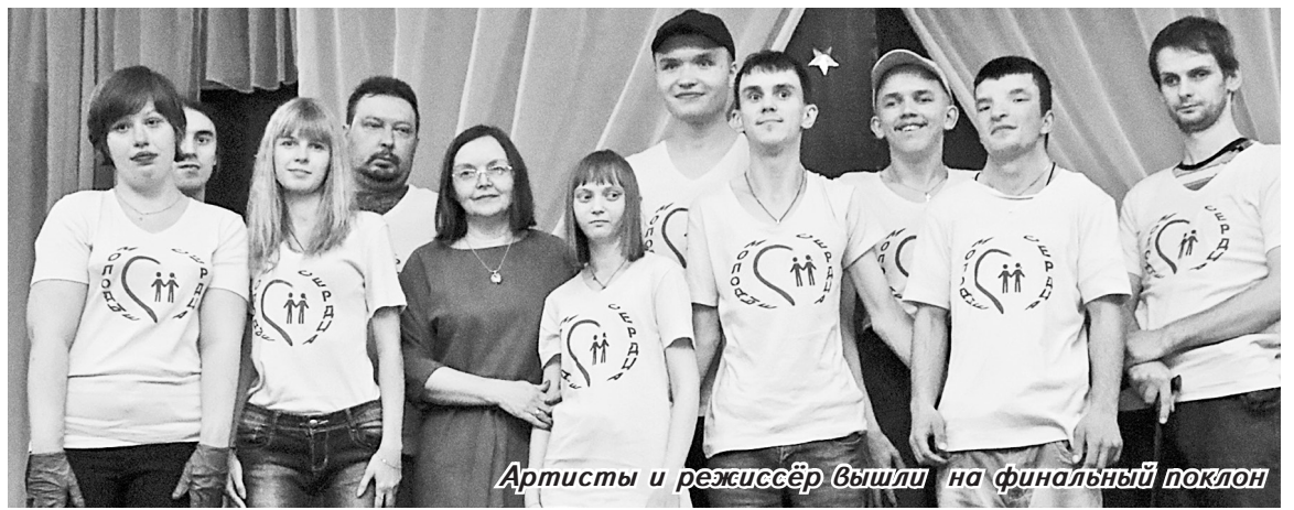
Артисты и режиссёр вышли на финальный поклон

В ФОК «Олимп» прошёл розыгрыш кубка области среди мужчин. Участвовали 8 команд.