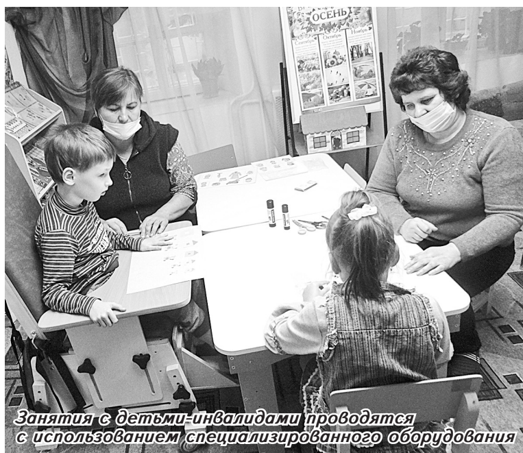
Занятия с детьми-инвалидами проводятся с использованием специализированного оборудования