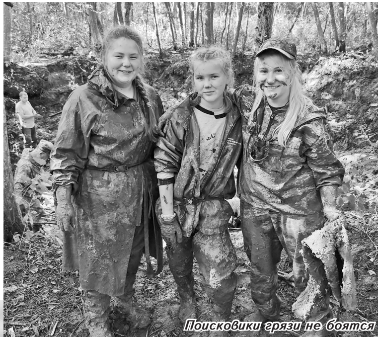
Поисковики грязи не боятся

В целом за семь лет работы поисковой группы имени 177-й стрелковой дивизии удалось обнаружить 297 незахороненных солдат, установить 15 имён, у восьми бойцов найти родственников (трое были захоронены на малой родине).