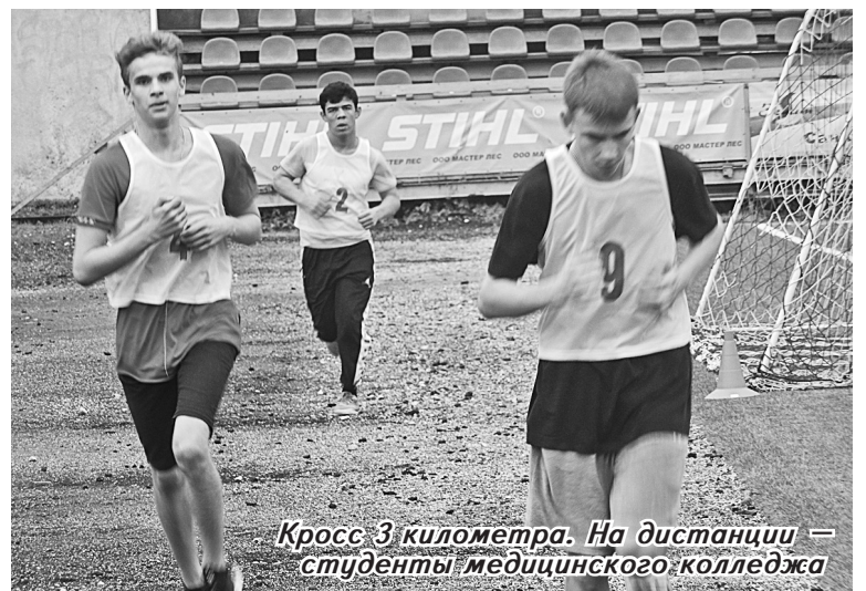
Кросс 3 километра. На дистанции — студенты медицинского колледжа