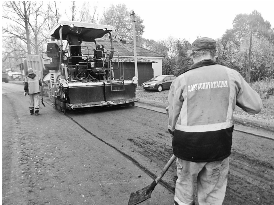
Укладка асфальта на улице Кооперации (Вельгия)

В этом году благодаря областной субсидии удалось отремонтировать значительное количество дорог и тротуаров в городе.